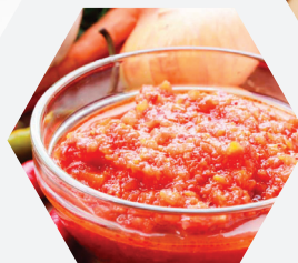
Desintegración de sólidos