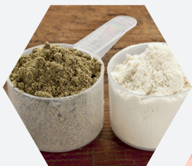
Mezcla de polvos