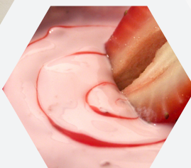
Adición de sabores